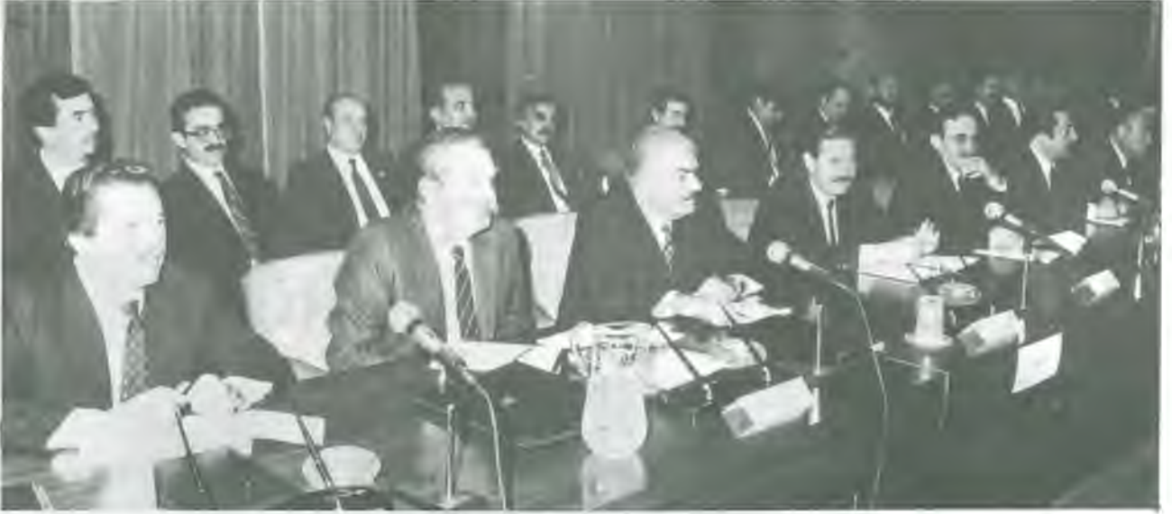
TÜRK-İŞ Yöneticileri birarada...