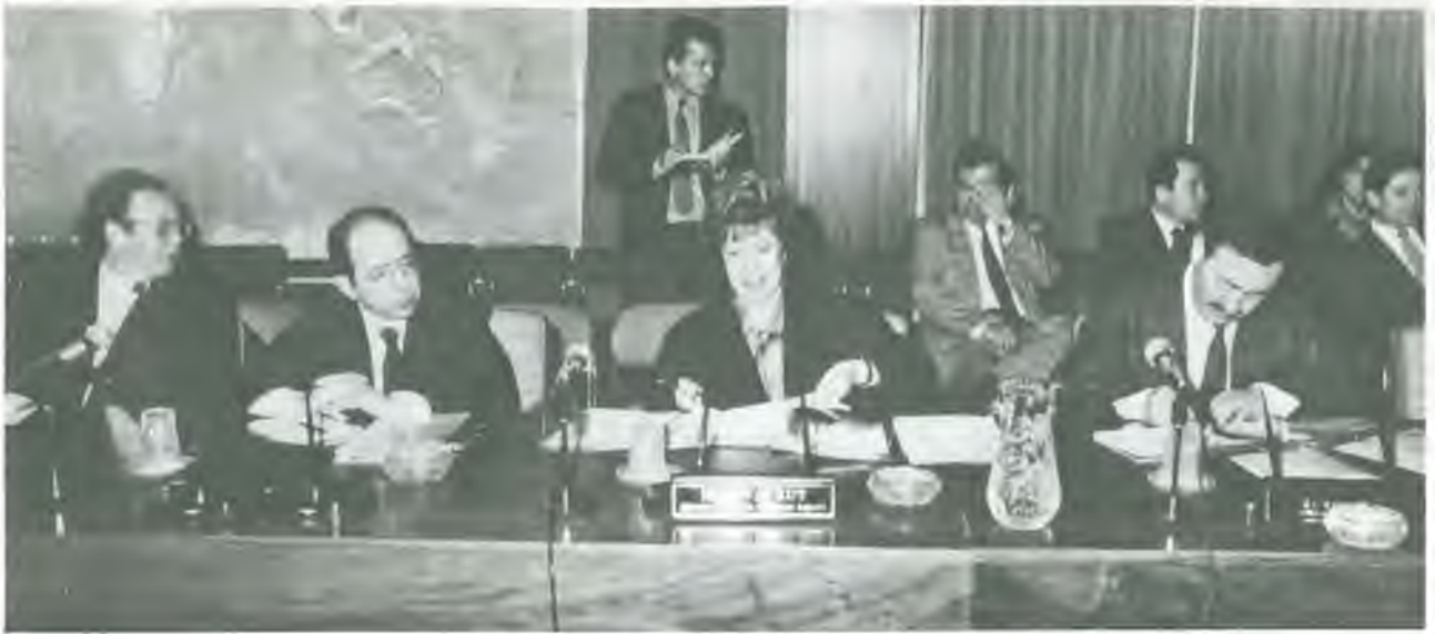
Ortak toplantıya Çalışma Bakanı da katıldı...

de görüşlerimiz nedir? Bunlara ait bilgileri karşılıklı anlayış havası içerisinde birbirimize vermeye çalışacağız.”