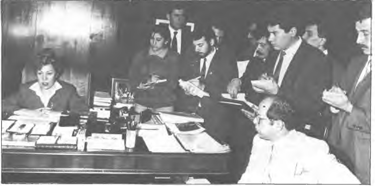
Çalışma yasalarında yapılacak değişiklik önerilerini, Çalışma ve Sosyal Güvenlik Bakanı İmren Aykut, düzenlediği bir toplantıda basın mensuplarına açıkladı.