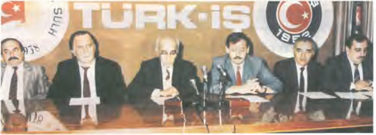
Dört büyük belediyede çalışan 51 bin işçinin toplu sözleşme görüşmelerinin anlaşmazlıkla sonuçlanması üzerine TÜRK-İŞ Genel Merkezinde düzenlenen basın toplantısına katılan Belediye-İş yöneticileri...

de, 15 yıldan beri çalışan bir belediye işçisinin aylık ortalama ücreti brüt 104 bin lira, net 70 bin liradır. Yani 15 yıllık bir belediye işçisi ailesini günde 2 bin lira ile geçindirecektir. Emekliliğine 1 yıl kalmış 24 yıllık bir belediye işçisinin aylık ücreti ise, brüt 140 bin ve net 84 bin TL.'yi geçmemektedir. Bu adaletsizlik yetmiyormuş gibi, bir de karşımıza devletin örgütledi-TÜHİS aradan çekilsin. Bundan önce 400 muhtelif belediyemizde Belediye Başkanları ile bir masaya oturup sözleşmelerimizi serbest iradeyle imzaladığımız gibi, bu 4 büyük ilimizde de sayın Belediye Başkanlarımızla karşılıklı oturup, sorunlarımızı halleder, toplu sözleşmemizi imzalarız. Çünkü bir tarafta sendika, öbür tarafta onun muhatabı belediyelerdir. Üçüncü şahıs durumunda olan TÜHİS, bizi anladığı TÜHİS'i çıkarıyorlar."