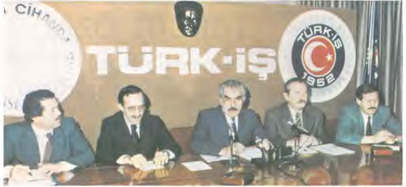
TÜRK-İŞ Yönetim Kurulu Üyeleri, Başkanlar Kurulu toplantısında.