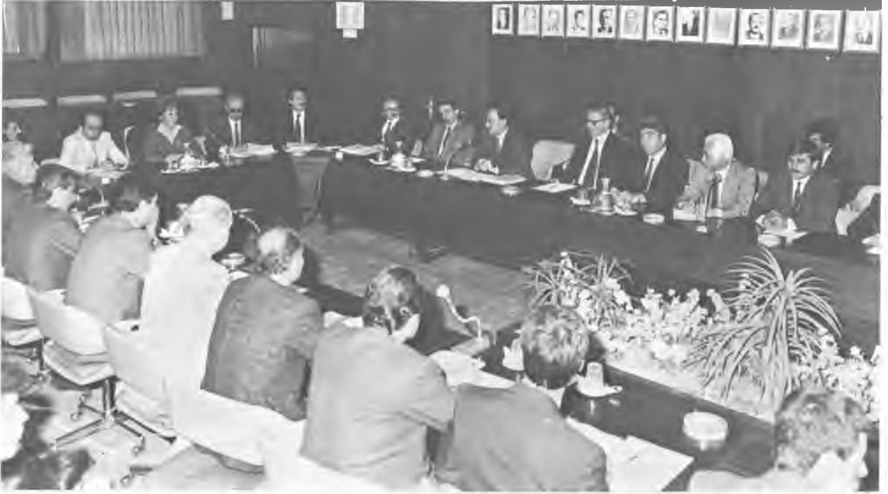
Dergimiz baskıya girdiği sırada devam eden Asgari Ücret Tespit Komisyonu çalışmalarından bir görünüş...

A sgari ücretin yeniden belirlenmesi için 5 Mayıs'ta toplantılara başlayan Komisyonun çalışmaları Dergimiz baskıya girdiği sırada sürüyordu.