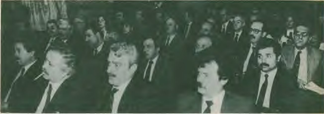
"Tüketicinin Korunması Ulusal Konferansı"na katılanlardan bir grup görülüyor.