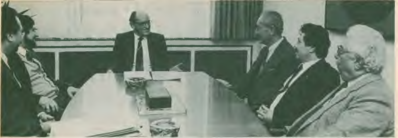
Türk-İş ile DGB Sürekli İşbirliği Komisyonunun Münih'te yaptığı toplantıdan bir görünüş.