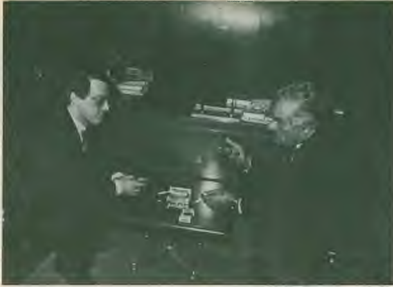
Devlet Bakanı Mesut Yılmaz ile Türk-İş Genel Başkanı Şevket Yılmaz çeşitli sorunları görüştüler.