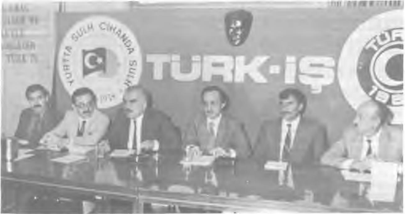
13 Ekim'de TÜRK-İŞ Toplantı salonunda yapılan ve TÜRK-İŞ Genel Başkanı Şevket Yılmaz'ın da katıldığı Sağlık-İş Başkanlar Kurulu Toplantısında Sendika Yeni Yönetim Kurulu Üyeleri birarada.

İki gün süren toplantıda toplu sözleşmelerle ilgili konular ele alındı