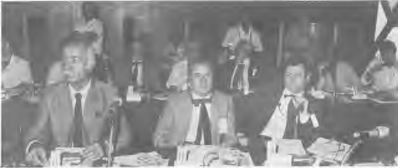
3 gün süren toplantıdan başka bir görünüş.

Özal Hükümeti temel hak ve özgürlükleri kısıtlayan bu düzenlemelerden geniş ölçüde yararlanmaktadır ve elindeki tüm imkânları kullanarak bunları