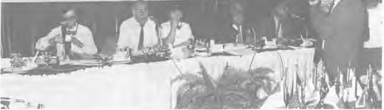
Teksif Sendikasının organizasyonu ile Antalya'da yapılan ITGLWF İcra ve Başkanlar Kurulu Toplantısında, üye sendikaların bulunduğu ülkelerdeki sorunlar tartışıldı.

TEKSTİL, DERİ VE GİYİM İŞÇİLERİ FEDERASYONU İCRA KURULU VE BAŞKANLAR KURULU TOPLANTILARI 25-27 Ekim 1987 ANTALYA